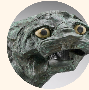
MARI Métropole de l'Euphrate