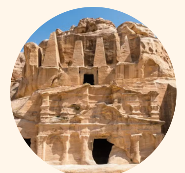
PÉTRA Au royaume des Nabatéens