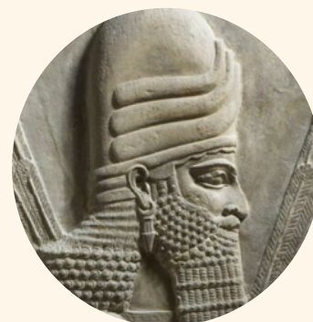
KHORSABAD Capitale de Sargon II