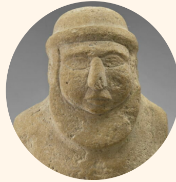
URUK Naissance des villes

Ce cycle de conférences vous convie à la (re)découverte de certaines d'entre elles : Uruk, Tello, Mari, Suse, Babylone, Hattusa, Ougarit, Byblos, Khorsabad, Persépolis, Palmyre et Pétra.