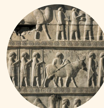
PERSÉPOLIS Au coeur de l'empire perse