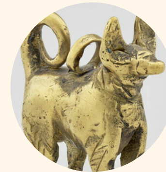
HATTUSA Capitale du Hatti