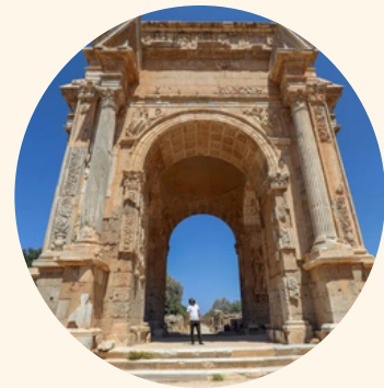
UGARIT Cité-royaume du Levant