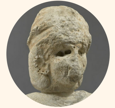
SUSE Cité royale de l'Élam