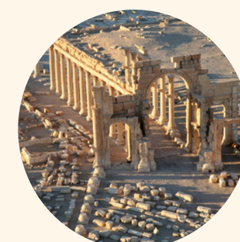
PALMYRE Cité du désert