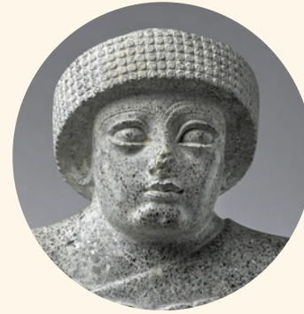
TELLO Découverte des Sumériens