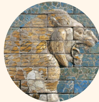
BABYLONE Joyau des Chaldéens